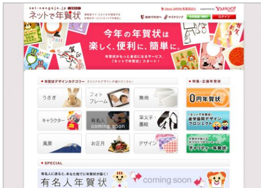
「ネットで年賀状」トップページ ※開発中の画面イメージです。

サービス紹介ムービー: http://www.youtube.com/netdenengajo