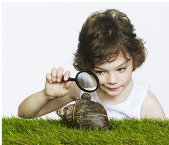
sb10063648b-007, Brand New Images